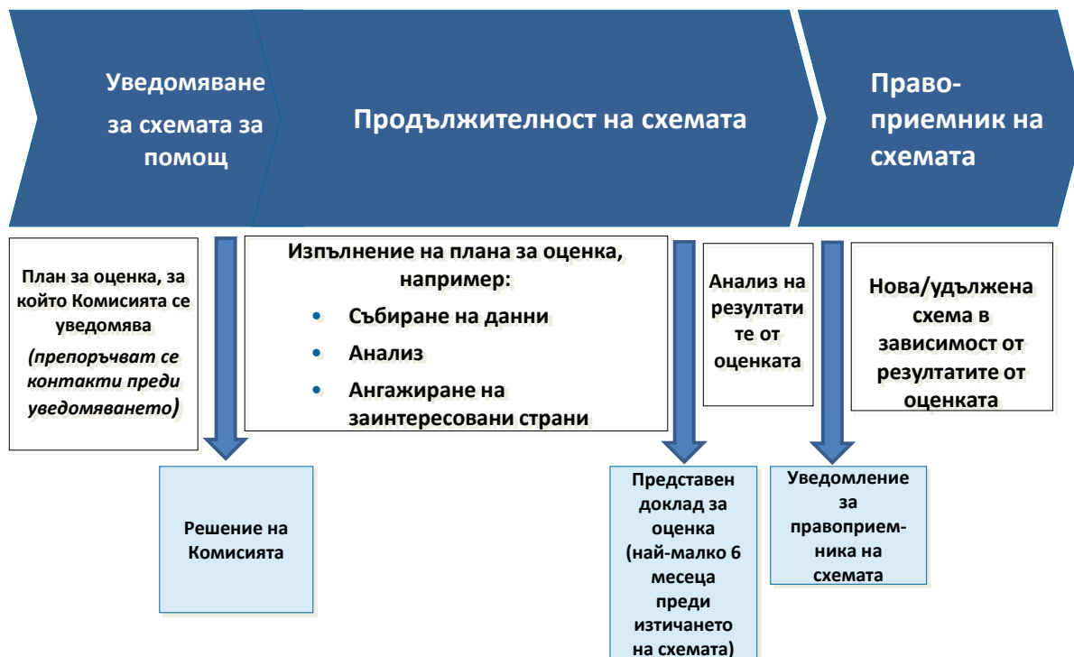
Фигура 2 — Нагледно представяне на процеса на оценяване за схеми, които подлежат на задължение за уведомяване