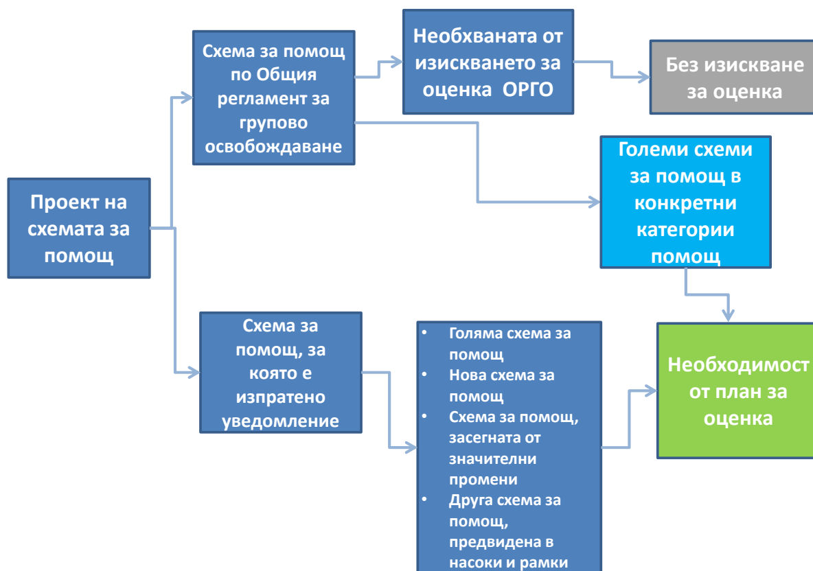
Фигура 3 — Подбор на схеми за помощ за целите на оценката

В насоките за различните области на държавна помощ са посочени също така някои схеми за помощ, при които оценката би била от особено значение.